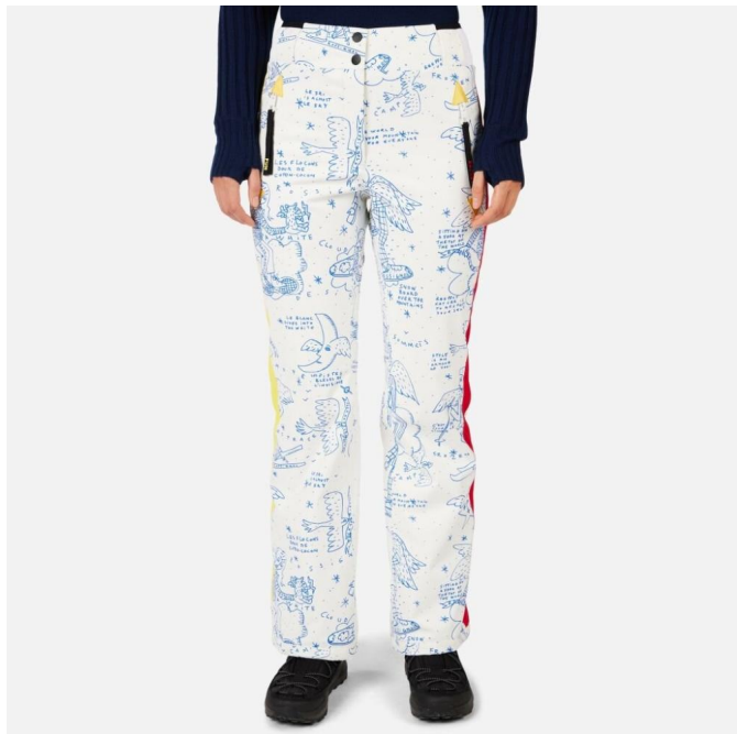
Rossignol W JCC SUBLIM PANT-SNOW ANGEL ARTIC PRINT-kalhoty