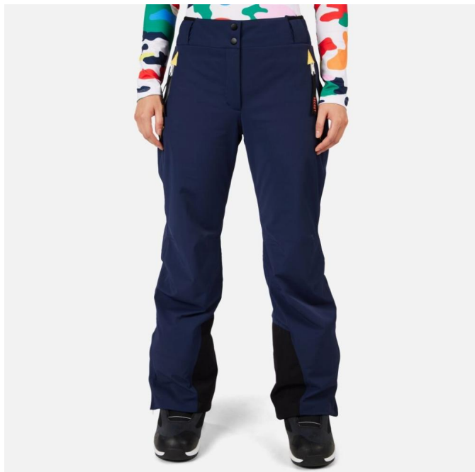
Rossignol W JCC VALTHOR PANT-COSMIC BLUE-kalhoty