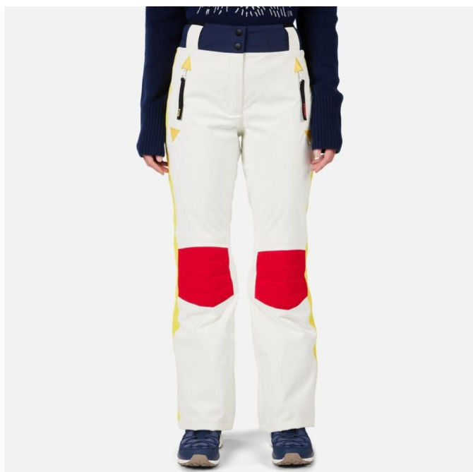
Rossignol W JCC VALDIZ PANT-ARCTIC-kalhoty