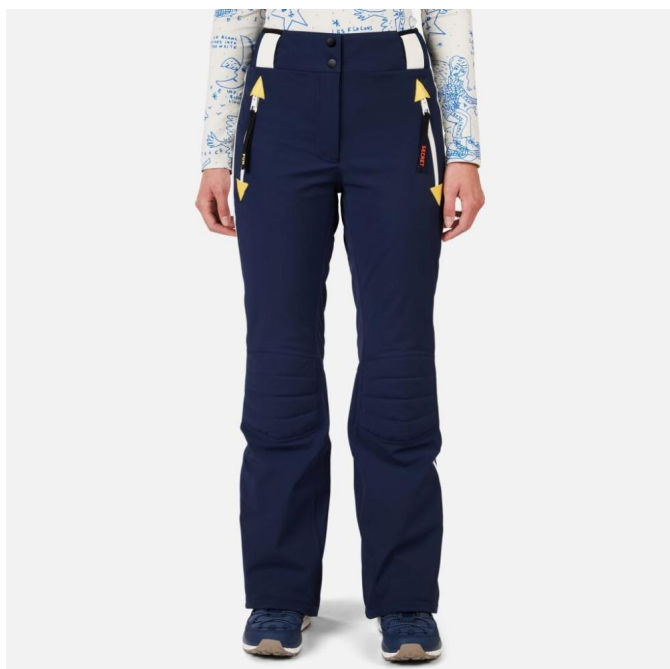
Rossignol W JCC VALDIZ PANT-COSMIC BLUE-kalhoty