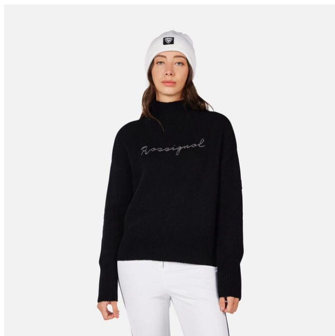
Rossignol W SIGNATURE SWEATER-BLACK-svetr