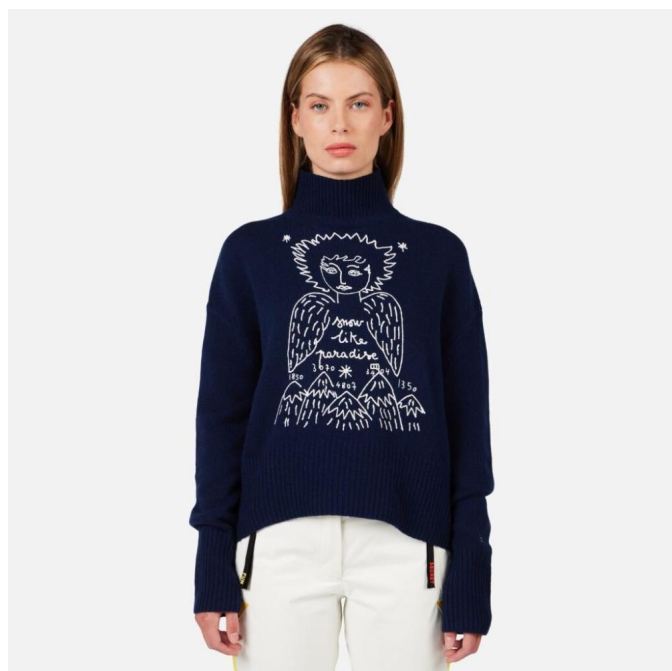
Rossignol W JCC SNOW ANGELS PULL-COSMIC BLUE-svetr