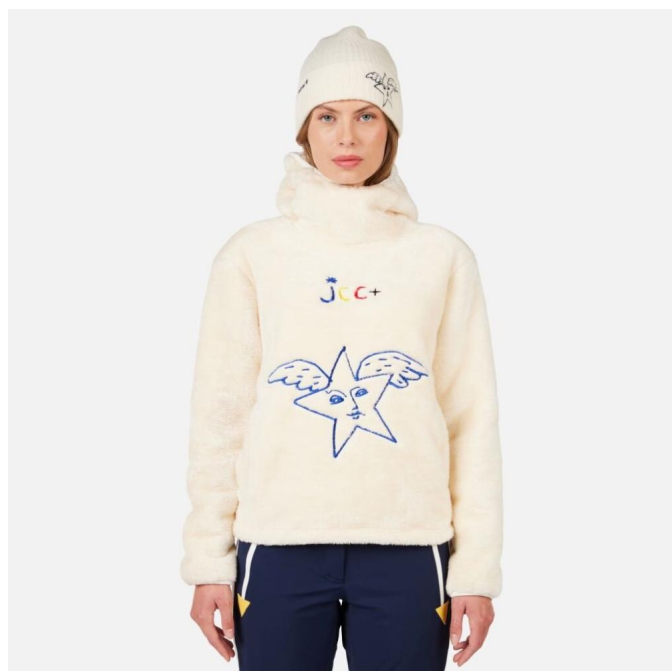
Rossignol W JCC VALDIZ FLEECE-ARCTIC-mikina