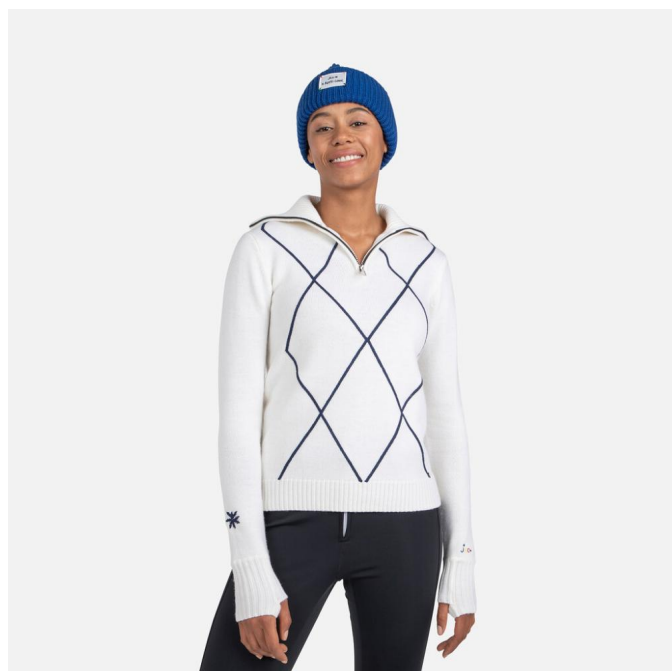
Rossignol W JCC 1/2 ZIP-WHITE-svetr