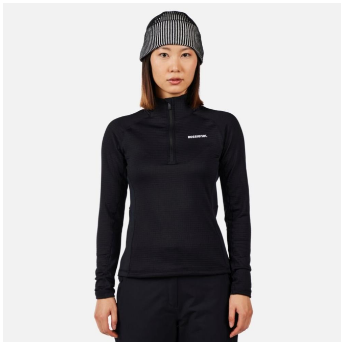
Rossignol W BLACKSIDE MIX HZ FLEECE-BLACK-mikina