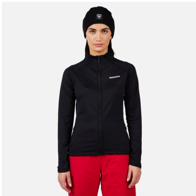
Rossignol W BLACKSIDE MIX FZ FLEECE-BLACK-mikina