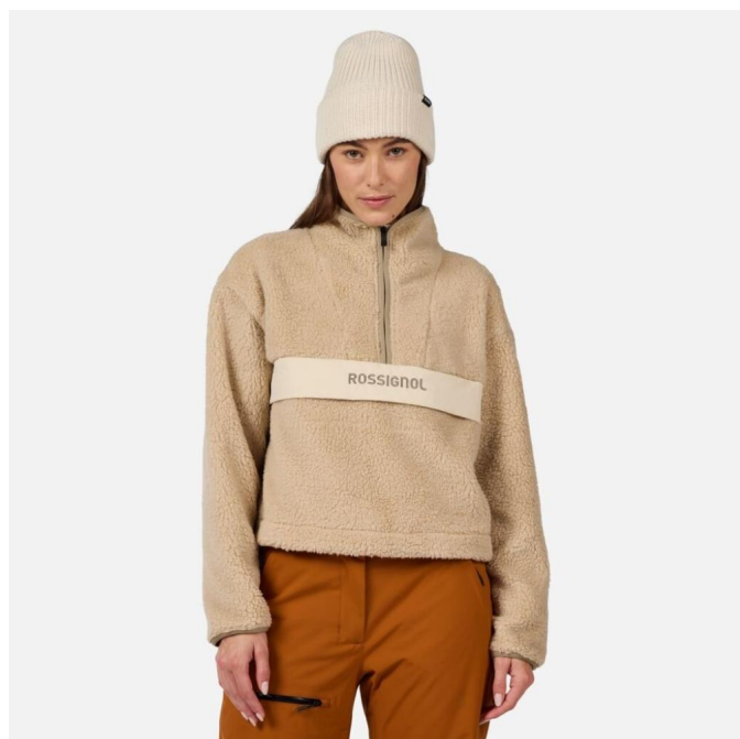
Rossignol W ALLTRACK HZ FLEECE-FOG-mikina