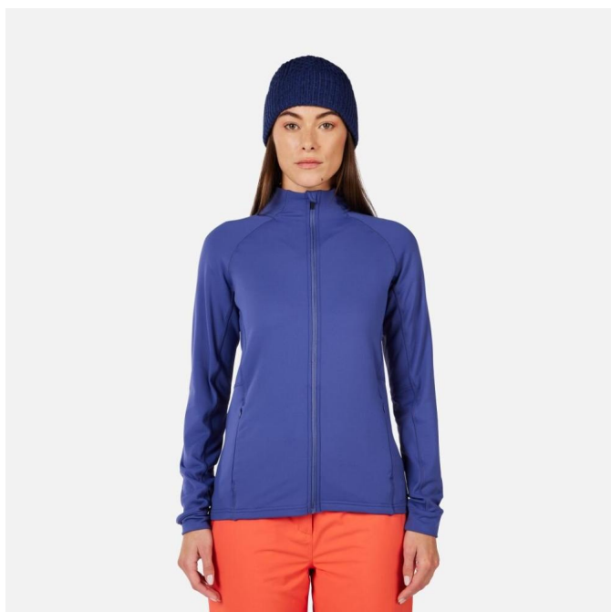
Rossignol W MID LAYER STRETCH JKT-FUTURE BLUE-mikina