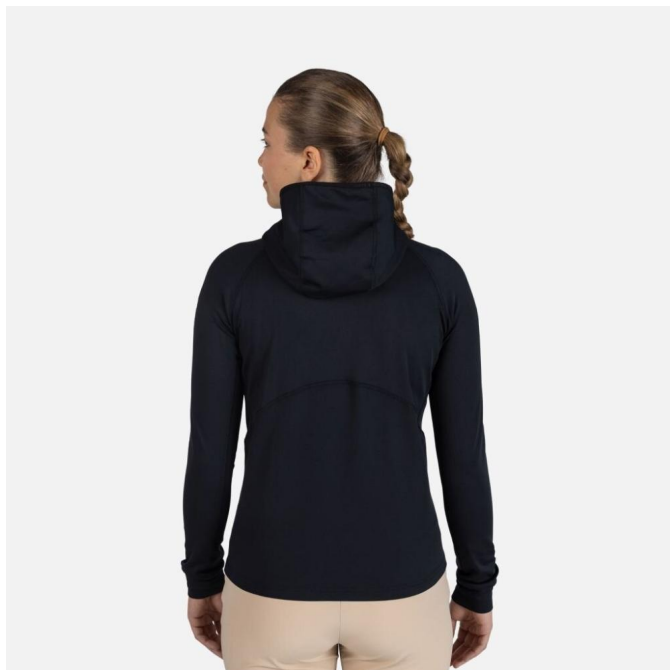
Rossignol W MID LAYER THIN FZ-BLACK-mikina