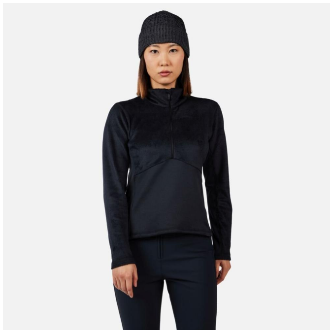
Rossignol W DIRETTA HZ FLEECE-BLACK-mikina