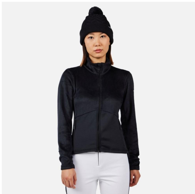
Rossignol W DIRETTA HZ FLEECE-BLACK-mikina