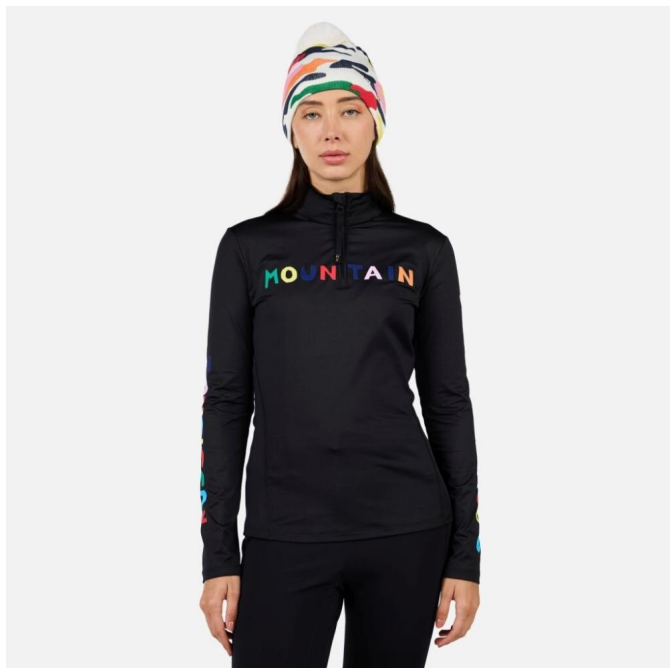
Rossignol W JCC BOOSTER HZ-BLACK-mikina