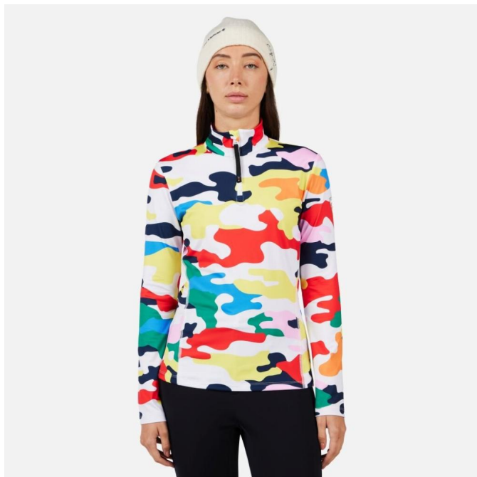
Rossignol W JCC BOOSTER HZ-JCC CAMO PRINT-mikina