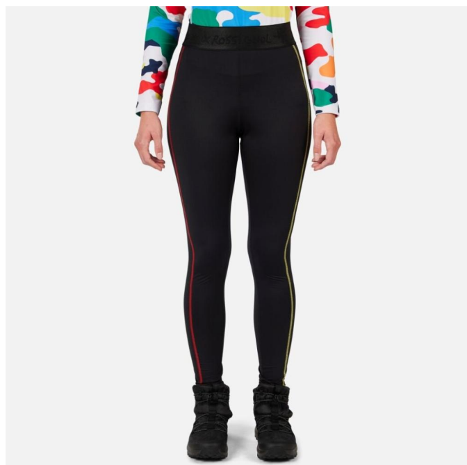
Rossignol W JCC BOOSTER TIGHTS-BLACK-legíny