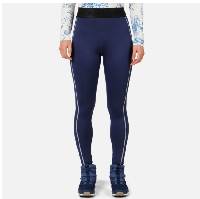
Rossignol W JCC BOOSTER TIGHTS-COSMIC BLUE-legíny