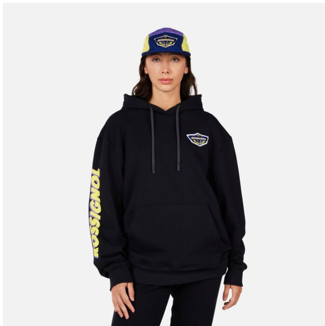
Rossignol SUPER HOODIE-BLACK-mikina