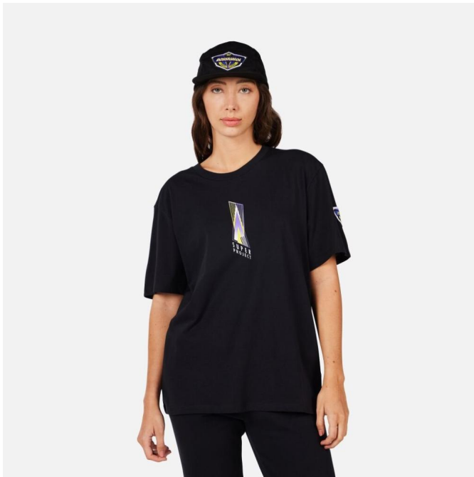
Rossignol SUPER TEE-BLACK-triko