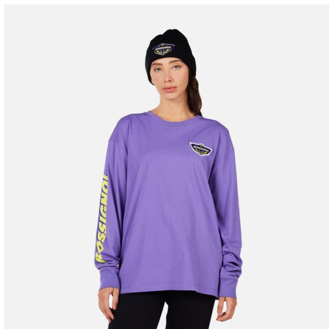
Rossignol SUPER LS TEE-SUPER VIOLET-triko