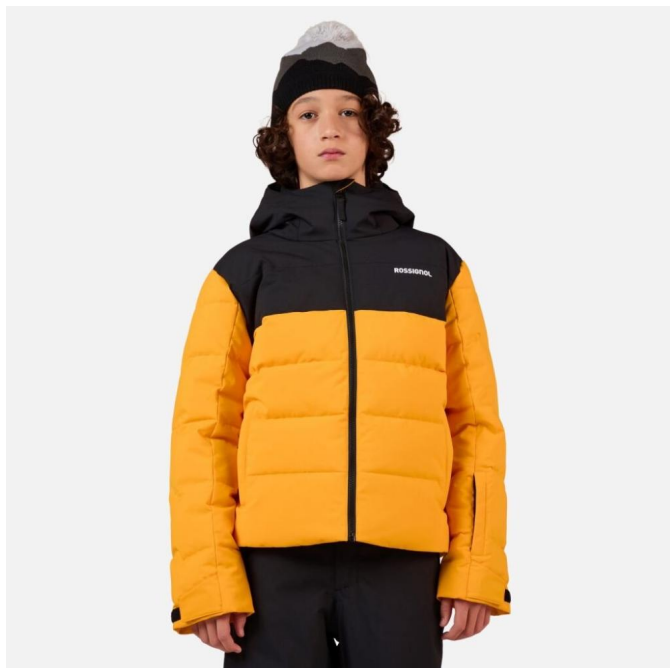
Rossignol BOY SIZ QUILTED JKT-SAFFRON YLW-bunda