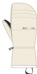
Rossignol W PERFY M-NATURE WHITE-rukavice

Rossignol W PERFY M-NATURE WHITE-rukavice Teplé a suché ruce vám umožní soustředit se na lyžování. Dámské lyžařské palčáky Rossignol Perfy nabízejí dobrou tepelnou izolaci, takže můžete pohodlně prozkoumávat hory. Pružná syntetická dlaň nabízí pevné uchopení