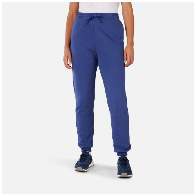
Rossignol W PRESSET PULLON PANT-FUTURE BLUE-kalhoty