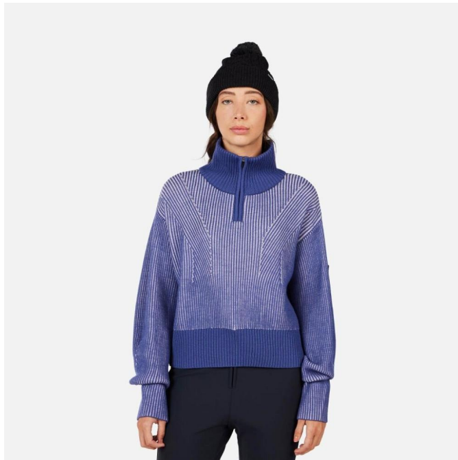
Rossignol W BRIGEL HZ MERINO SWEATER-FUTURE BLUE